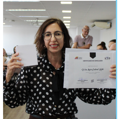
Vera - Ilha Solteira