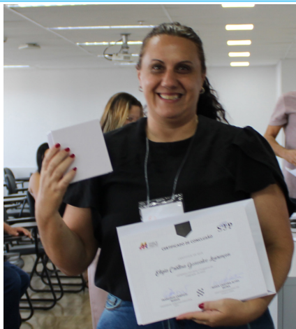
Eligia - Prudente