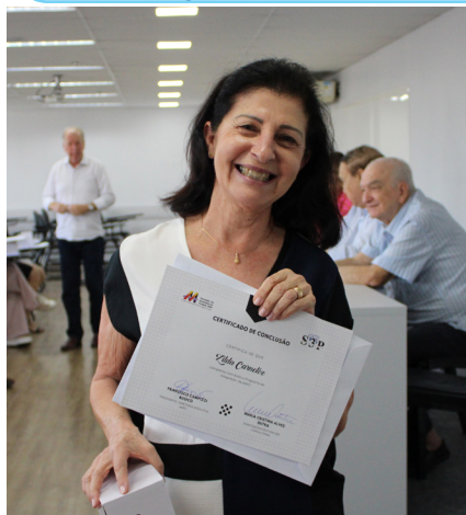
Zilda - Sede